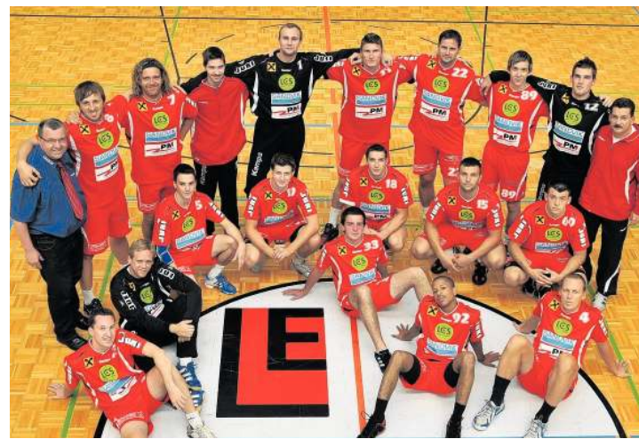
Die Handballer von Union Juri Leoben treffen ihre Fans im LCS.